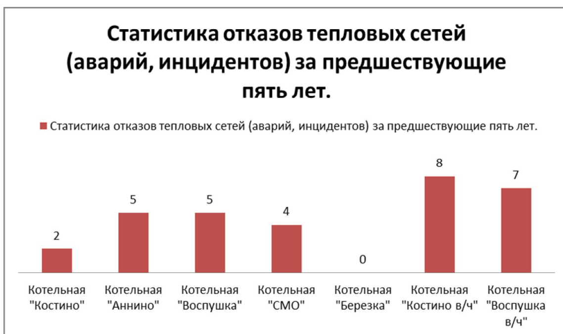
Рис.3. Статистика отказов тепловых сетей (аварий, инцидентов) за предшествующие пять лет.

В течение года тепловые сети эксплуатируются в разных режимах –зимний режим(отопительный), основная масса аварийных отключений происходит в этом режиме. Время восстановления теплоснабжения потребителей после аварийных отключений составляет максимум 4 часа. Статистика отказов тепловых сетей (аварий, инцидентов) за предшествующие пять лет отражена на рис.3.